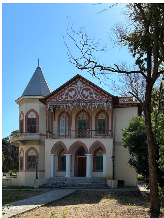
Η Βίλα Κόλλα στην Πάτρα